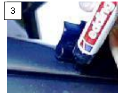
Abb. 2-1: Positionierung des vorderen Endstücks / Positioning of the front tail

Multirail 90185, 901851 (Mercedes), 90178, 901780 (Citroën und Derivate): Bei vorhandenem Schlaufdach mit Frontspoiler ggf. vorderes Ende der Multirail und vorderes Endstück an Dachspoiler anpassen (ausklinken).