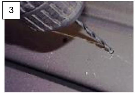
Abb. 3-1: Bohrung der vorderen Befestigungspunkte / Drill the front attachment points

DE: Die Multirail mit den mitgelieferten selbstbohrenden Blechschrauben befestigen (s. Abb. 3-2):