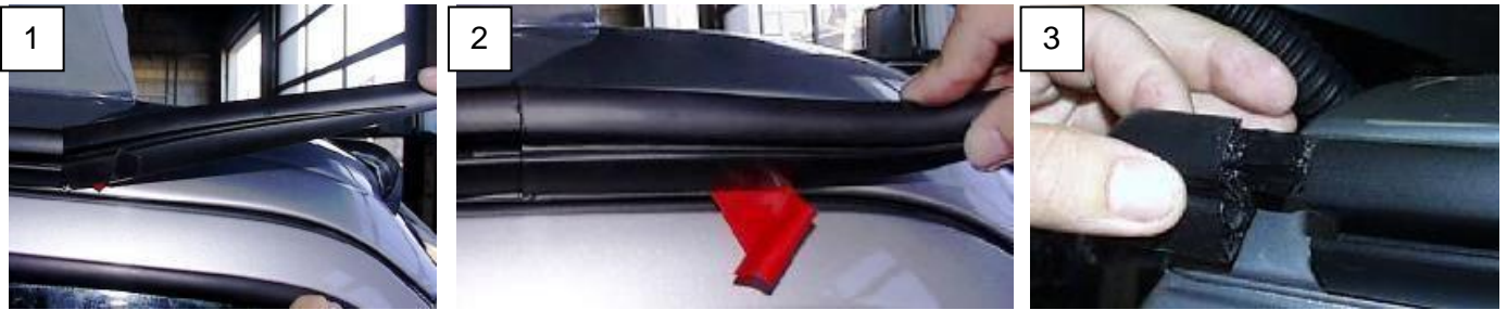
Abb. 5-1: Verklebung der Endstücke / Gluing of the end pieces

DE: Zum Abschluss den oberen Übergang vom Fahrzeug zur Multirail mit einer dünnen Sikaflexnaht abdichten.