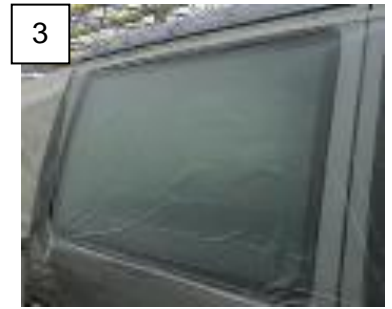
Abb. 1-1: Vorbereitungen am Fahrzeug / Preparations on the vehicle