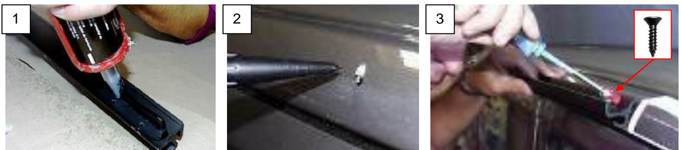
Abb. 4-2: Verklebung der Multirail / Gluing the Multirail

EN: Also clean the gluing area on the Multirail with adhesive cleaner and brush on Primer. Cut the tip of the Sikaflex cartridge diagonally to size 2 and apply Sikaflex (see Abb. 4-2, 1). Seal each hole on the vehicle with a drop of Sikaflex (2). Then fasten the Multirail with the stainless steel screws (3). Remove excess Sikaflex carefully with Sikaflex Remover.