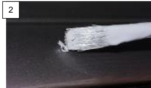
Abb. 4-1: Vorbereitung der Klebefläche / Preparation of the gluing area

DE: Den Verkleberegion auf der Multirail ebenfalls mit Haftreiniger reinigen und primern. Die Spitze der Sikaflex-Kartusche schräg auf Größe 2 anschneiden und Sikaflex auftragen (s. Abb. 4-2, 1). Jede Bohrung am Fahrzeug mit einem Tropfen Sikaflex abdichten (2). Anschließend die Multirail mit den Edelstahlschrauben befestigen (3). Überschüssiges Sikaflex vorsichtig mit Sikaflex Entferner entfernen.